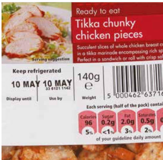
Tryck med sifferhjul med fasta månader