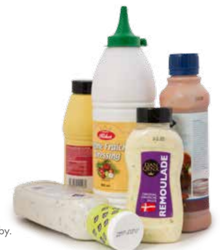
Några av de produkter som märks hos AAK Dalby.

Förstudien var en viktig faktor i detta projekt. Dels för att säkerställa funktionen men också för att kunna klara av den tuffa leveranstiden. Genom att testa och dokumentera varje produkt innan tillverkning kunde vi producera utrustningen utan förseningar.