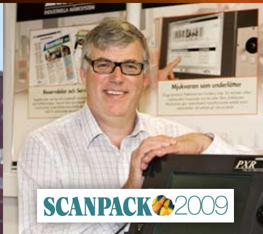
Besök oss på Scanpack