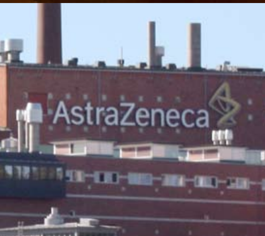
Vi levererar till AstraZeneca