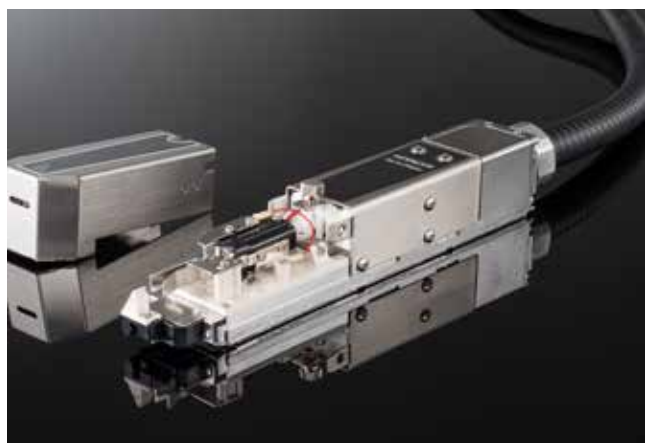
Nytt skrivhuvud med 90° graders slanganslutning och fasad skyddskåpa.

– Som tekniker får man alltid favoriter när det gäller tekniska lösningar och i den nya UX-skrivaren har Hitachi plockat tillbaka några av tidigare lösningar. Generellt kommer tidigare användare att känna igen gränssnittet och det enkla handhavandet i den nya UX modellen.