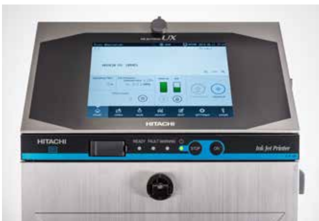
UX modellen är utrustad med en stor färgskärm som nu kan visa bilder.

– Det har varit ett stort fokus de senaste åren på förbrukning och kostnadsbesparingar hos samtliga tillverkare på marknaden. Hitachi har med den nya modellen och det nya systemet för vacuum kunnat reducera förbrukningen och därmed kostnaderna ytterligare.